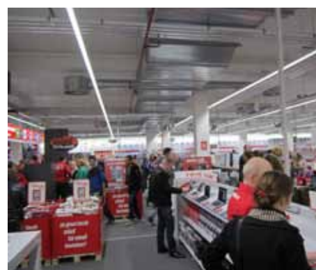
De bezoekersaantallen stijgen nog steeds.

Raadhuisplein past volgens Arco prima bij de ambities van Media Markt. 'Het winkelcentrum en het plein met de horeca zijn prachtig, maar nog niet af. Als de laatste fase van de bouw straks is afgerond, kunnen we het hier nog aantrekkelijker maken. Ik zou het plein wel autovrij willen zien, de parkeergarage is vlakbij, goedkoop en er is voldoende plek. De bereikbaarheid is een groot voordeel van het centrum van Drachten. Voor wie hier nog niet is geweest: kom vooral eens kijken. We willen uw verwachtingen overtreffen!'