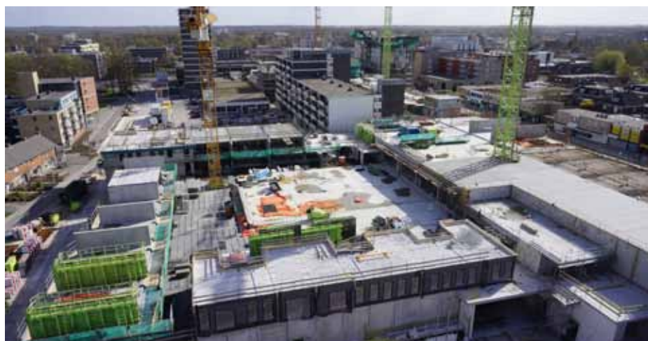
G. Booi, Downview.nl

Overigens is er in blok A ook een dubbele laag winkels. De voorbereidingen voor de toekomstige daktuin zijn ook begonnen; de staalconstructie staat er inmiddels. De daktuin is heel mooi te zien op www.raadhuispleindrachten.nl (Beelden > Visualisatie).